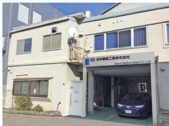
■関西工場 〒555-0012 大阪市西淀川区御幣島6丁目12-22 PHONE (06) 6471-7454(代) FAX (06) 6472-1980