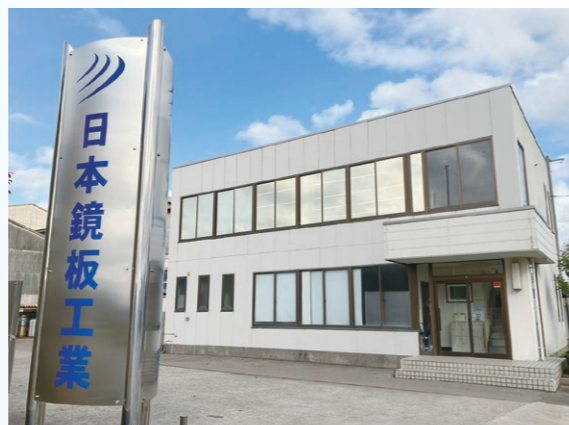
■北陸工場 〒924-0051 石川県白山市福留町625 PHONE (076) 277-1200(代) FAX (076) 277-1831