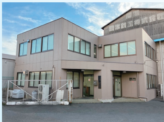
■九州営業所 〒803-0801 福岡県北九州市小倉北区西港町10 PHONE (093) 561-1480(代) FAX (093) 561-4476