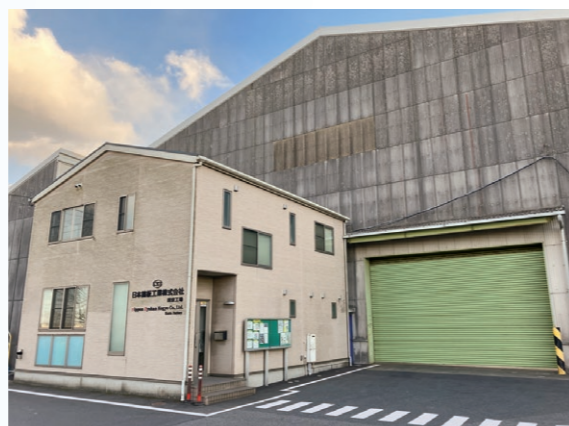
■関東工場 〒300-0726 茨城県稲敷市西代680 PHONE (0299) 78-3501(代) FAX (0299) 78-3554