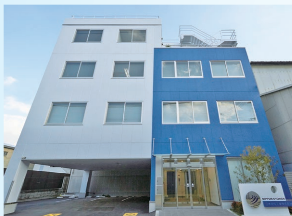
■本社／海外事業部 〒555-0012 大阪市西淀川区御幣島6丁目12-22 PHONE (06) 6472-4772(代) FAX (06) 6477-1430 ■関西営業部 PHONE (06) 6471-6031(代) FAX (06) 6472-1996