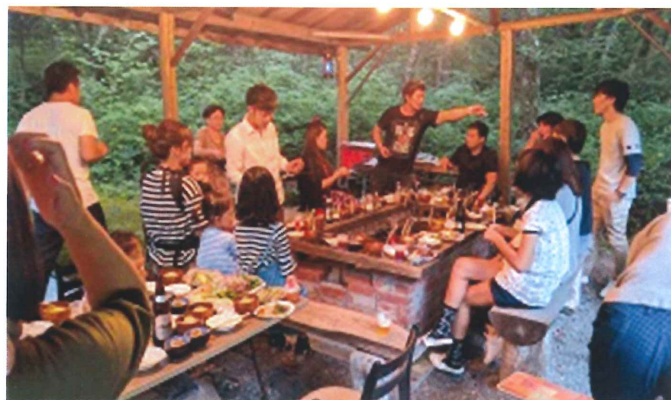
8月のバーベキュー